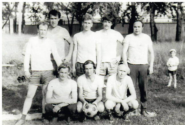
Команда цеха №103, 1990 год

В состав зимней рабочей спартакиады входили силовая гимнастика (мужчины подтягивались на перекладине, женщины отжимались от гимнастической скамейки) и лыжные гонки (первый день - стиль классический, второй – стиль свобод-