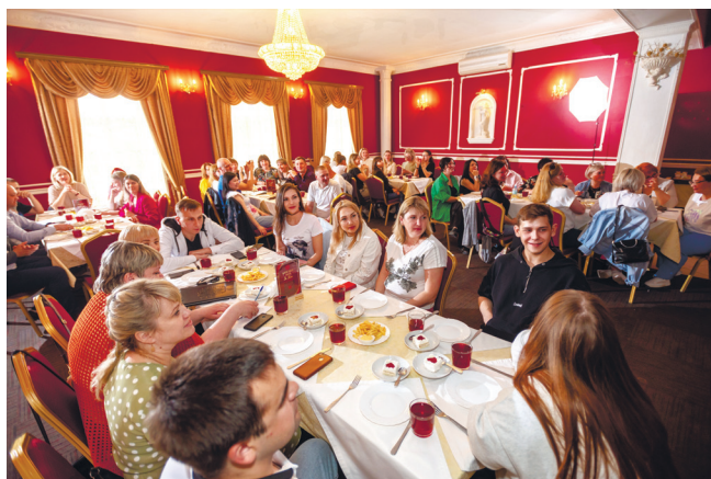
Работники МСЗ играют в антиквиз

Необычная увлекательная игра, приправленная веселыми шутками, зажигательной музыкой и популярными песнями, мастерски поданная активными, харизматичными, жизнерадостными ведущими никого не оставила