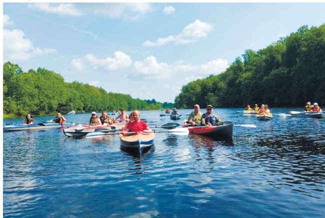
Заплыв на байдарках

- Поездка вышла просто замечательной, - го-