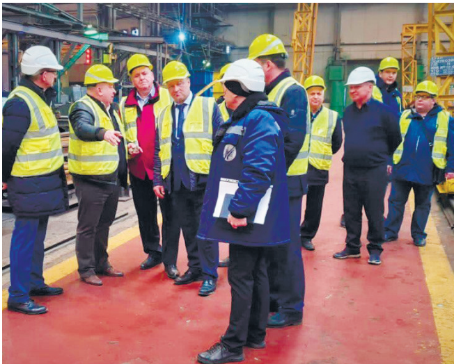
Комиссия РЖД на заводе