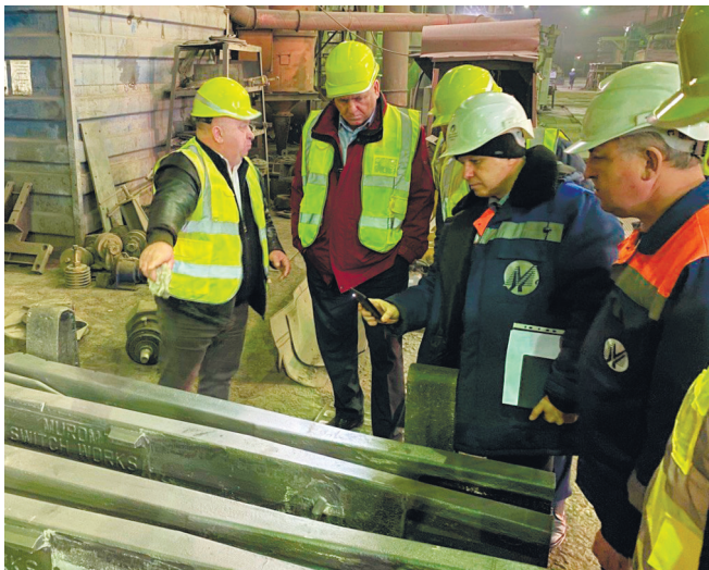
Презентация продукции завода