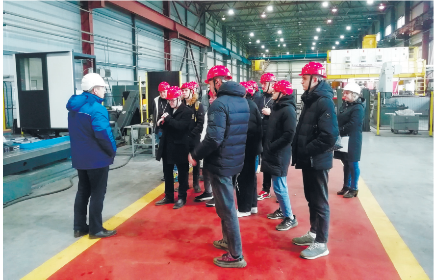
Студенты колледжа - на заводе

Кстати, выпускники колледжа сейчас работают на нашем заводе на различных должностях.