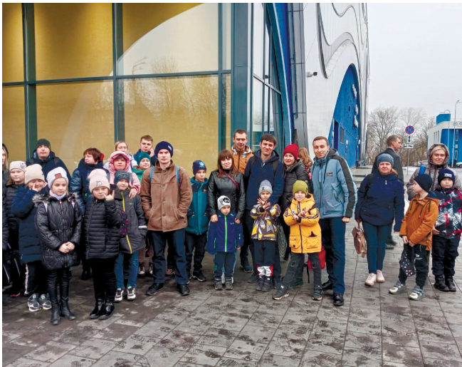
Заводчане и члены их семей

Полученные положительные эмоции и заряд бодрости способствуют укреплению здоровья и позитивной настрою заводчан.