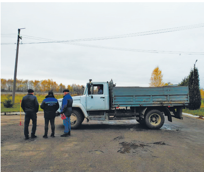
Момент практического конкурса