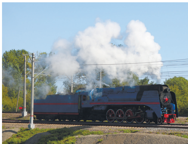
На динамической экспозиции