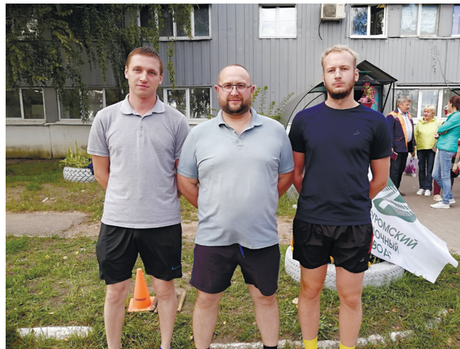
Команда отдела главного технолога