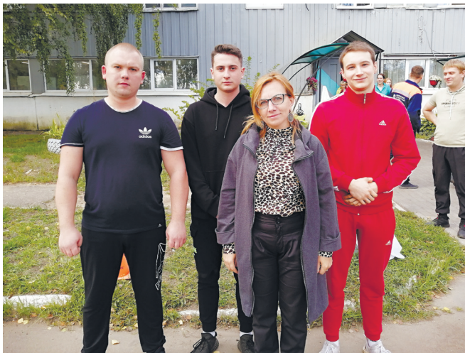
Команда цеха стрелочной продукции