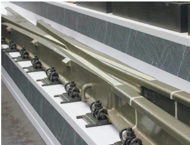
Крестовина проекта 8365

образования дефектов технологическими методами. В результате обсуждения, проведенного на выставке, достигнута договоренность провести широкие эксплуатационные испытания различных способов повышения эксплуатационных свойств крестовин.