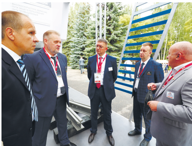
Руководители компаний группы ВСП

руководителей железных дорог по инфраструктуре и руководители ЦДИ. Специалисты познакомились с нашими новыми конструкциями и решениями, представленными на стенде.