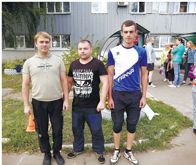
Команда СТОиРО №511