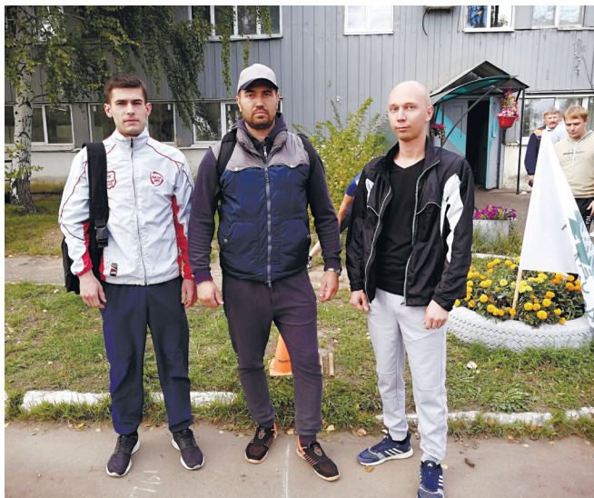
Команда инструментального цеха

Лучшее время среди всех групп показали бегуны цеха №301, преодолевшие дистанцию за 39,5 секунд.