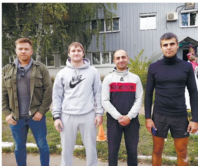
Команда группы быстрого реагирования ЧОО «Рубеж»