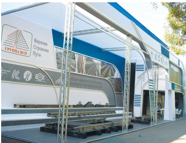
Стенд группы компаний ВСП

ны зависят от наличия внутренних дефектов отливки, которые упрочнение взрывом позволяет выявить или даже устранить. Муромский стрелочный завод предложил железнодорожникам устранить причины